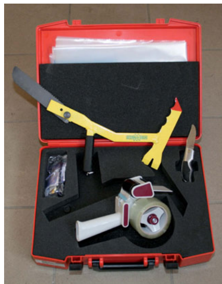
Glasmanagement-Set (siehe auch Seite 4)