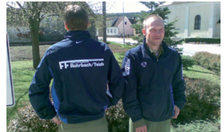
Die neuen Trainingsjacken

den sind. Möglich wurde dies durch ein Sponsoring der Malerei Marsch. Wir sagen nochmals recht herzlich DANKE für die großzügige Unterstützung!