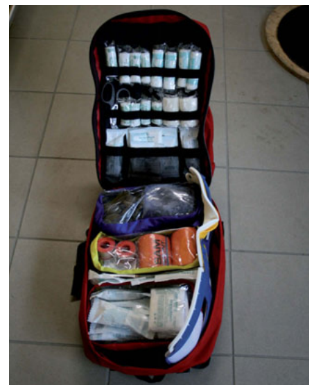
Erste Hilfe - Rucksack