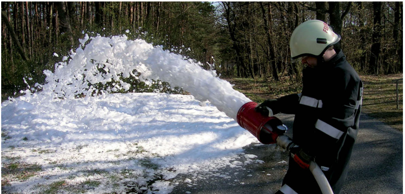
Schaumerzeugung mit dem Mittelschaumrohr