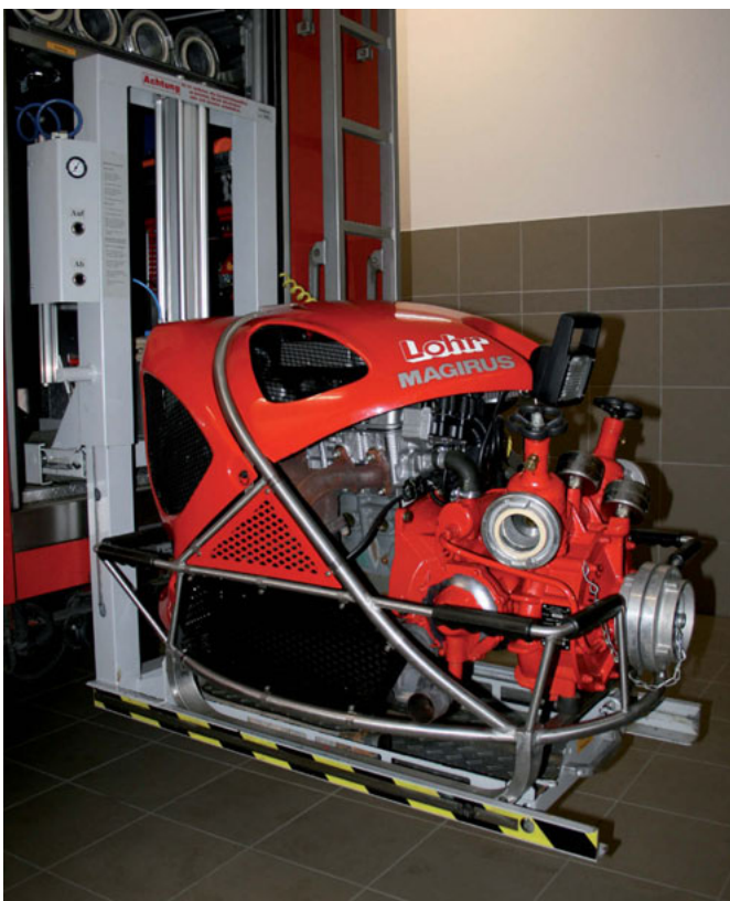
TS auf pneumatischer Absenkvorrichtung

Untergebracht ist die Tragkraftspritze auf einer pneumatischen Absenkvorrichtung im Heck des Feuerwehrautos. Die Absenkvorrichtung erleichtert das entnehmen und einladen der TS (mit immerhin ca. 190 kg) extrem.