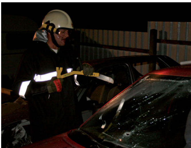
Das richtige Entfernen der Windschutzscheibe