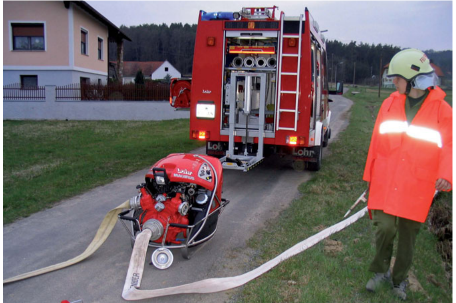
Tragkraftspritze bei Speisung aus einem Hydranten

Die tragbaren Pumpen besitzen einen eigenen Motor, meist einen Ottomotor oder in seltenen Fällen auch einen Dieselmotor. Als Antrieb fungieren in der Regel adaptierte serienmäßige Motoren (in unserem Fall ein Fiat-Punto-Motor). Die Leistungsgrenze dieser Pumpen steht in engem Zu-