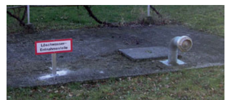
Neue Kennzeichnung der Löschwasser-Entnahmestellen

stellen leichter als bisher finden. Insgesamt wurden 3 Brunnen in Rohrbach/Bergen, die 2 Saugstellen im Teichbach und die Saugstelle beim alten Schwimmbad gekennzeichnet.