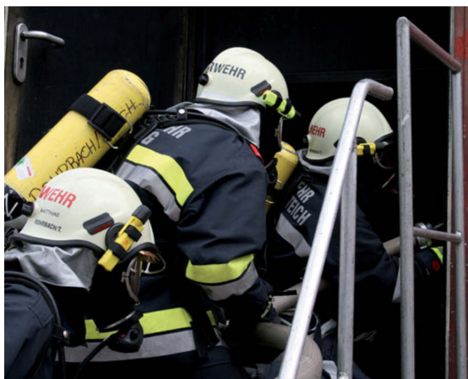
l.o.: Das richtige Betreten eines verrauchten Raumes r.o.: Die Erschöpfung nach der Übung r.u.: Der Brandsimulationscontainer von außen

führt werden, wie es z.B. auch bei einem Zimmerbrand der Fall wäre. Für die Atemschutzträger wichtige Erfahrungen die im Ernstfall helfen!