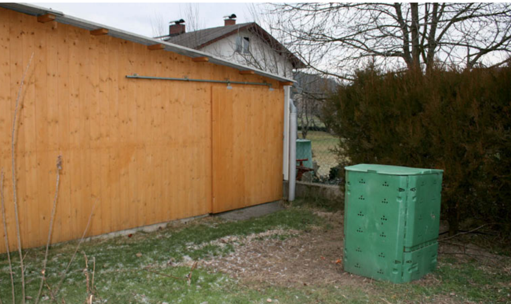
Eine Ausbreitung des Brandes konnte glücklicherweise verhindert werden

mit eine weitere Ausbreitung verhindert werden. 7 Mitglieder der FF Rohrbach waren bis ca. 23:10 Uhr im Einsatz.