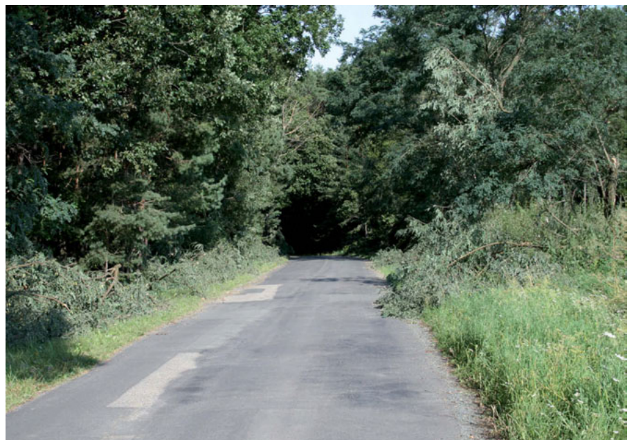
Unzählige Bäume und Baumteile mussten von der Straße entfernt werden

Auch Rohrbach blieb von den schweren Unwettern in der Nacht von 15.8.2008 auf 16.8.2008 nicht verschont. So mussten zwischen Rohrbach/Bergen und Neuberg/Bergen unzählige Bäume und Baumteile, die dem Sturm nicht standgehalten haben, von der Straße entfernt werden. Zur Sicherheit wurde danach auch noch eine Kontrollfahrt durch das restliche Ortsgebiet unternommen. 6 Mitglieder der FF Rohrbach waren von 01:30 bis 02:30 im Einsatz.